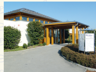
„Wie daham...“ Pflegezentrum Judenburg-Murdorf 8750 Judenburg . Ferdinand-von-Saargasse 3