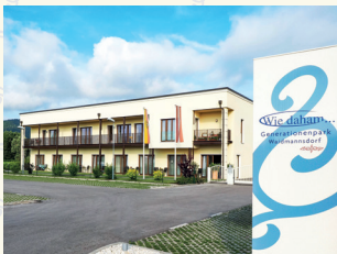
„Wie daham...“ Generationenpark Waidmannsdorf 9020 Klagenfurt am Wörthersee . Frodlgasse 6