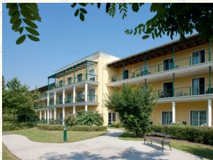
„Wie daham...“ Seniorenschlössl Simmering 1110 Wien . Oriongasse 9 und 11