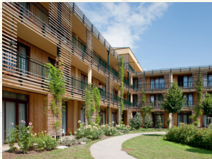
„Wie daham...“ Seniorenschlössl Atzgersdorf 1230 Wien . Hödlgasse 19