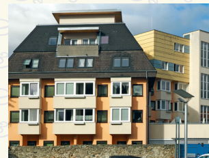
„Wie daham...“ Senioren-Stadthaus Judenburg 8750 Judenburg . Riedergasse 17