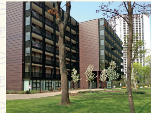
„Wie daham...“ Seniorenschlössl Brigittenau 1200 Wien . Winarskystraße 13