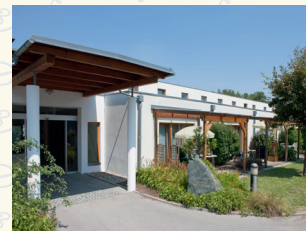
„Wie daham...“ Seniorenschlössl Donaustadt 1220 Wien . Ziegelhofstraße 86