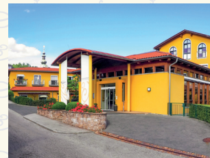
„Wie daham...“ Seniorenzentrum St. Martin-Kreuzbergl 9020 Klagenfurt am Wörthersee . Jantschgasse 1