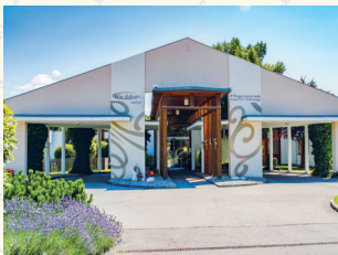
„Wie daham...“ Generationenpark Welzenegg 9020 Klagenfurt am Wörthersee . Steingasse 180