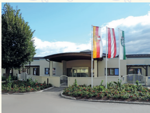
„Wie daham...“ Generationenpark Zeltweg 8740 Zeltweg . Aichdorfer Straße 2